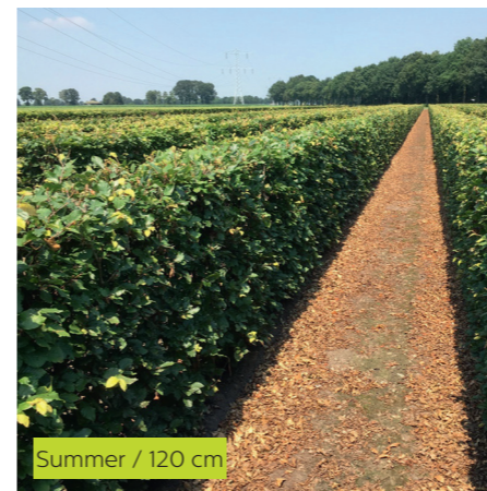
Summer / 120 cm