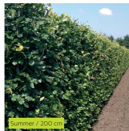
Summer / 200 cm