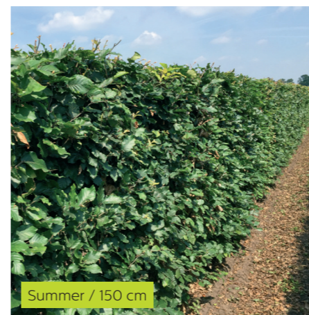
Summer / 150 cm