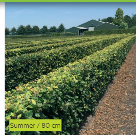
Summer / 80 cm